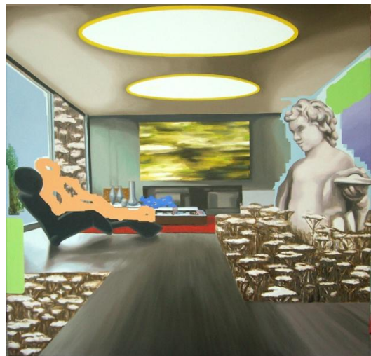
Room 16, 130 x 135 cm, 2008