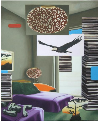
Room 7, 160 x 120 cm, 2008