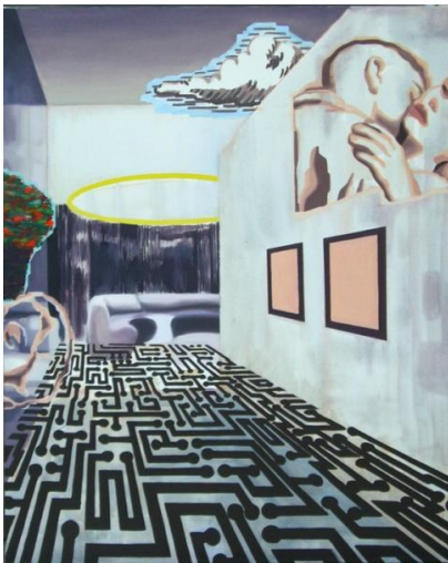
Room 24, 100 x 80 cm, 2008